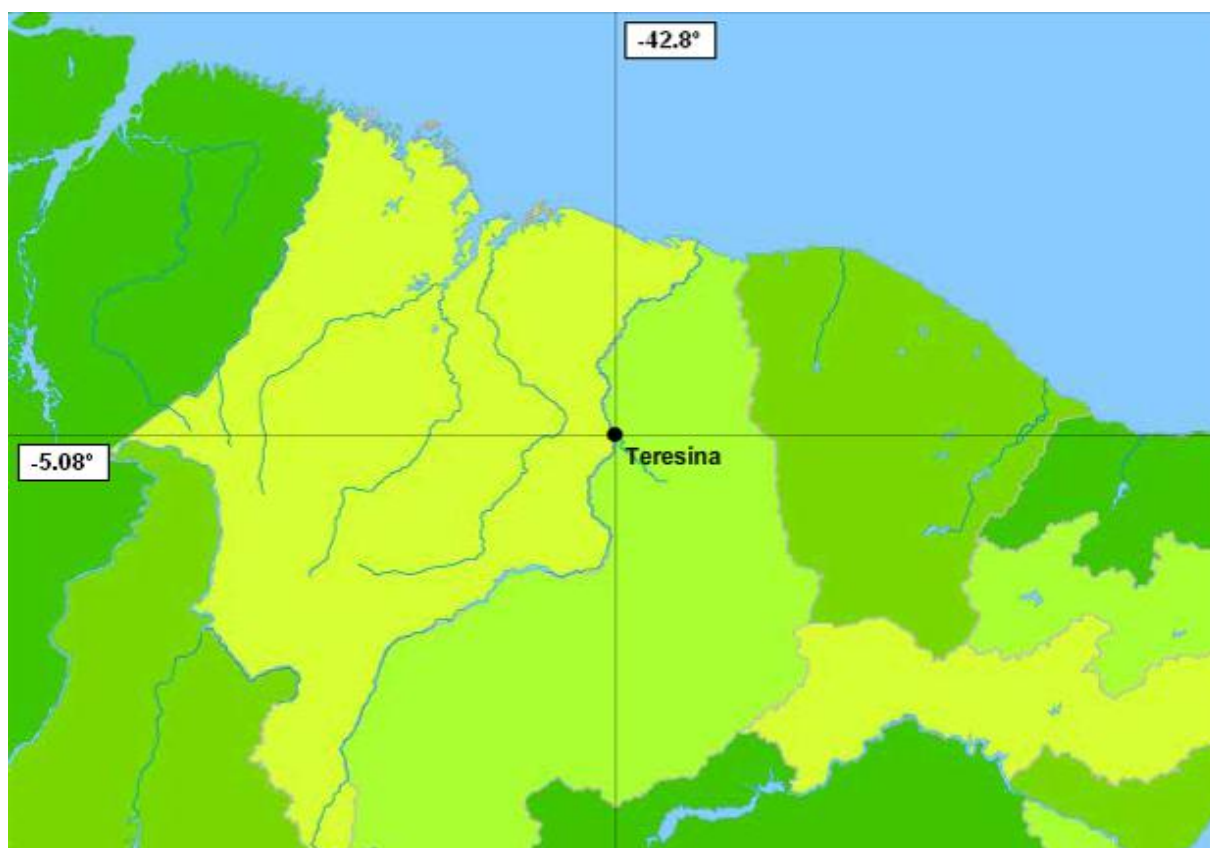
Figura 1 – Localização do Município de Teresina

Capital do Estado do Piauí, Teresina está localizada à margem do rio Parnaíba, é contornada pelo rio Poti e possui uma área territorial de 1.391,974 Km 2 , população total de 814.230 habitantes, destes 767.557 pertencentes à Zona Urbana e 46.673 a Rural, Teresina apresenta latitude de 5°5'20" ao sul e longitude de 42°48'07" ao oeste, localiza-se próximo à divisa com o Maranhão, ao oeste do estado, em uma altitude de 72 metros, em média. A cidade é separada da cidade de Timon (Maranhão) pelo Rio Parnaíba.