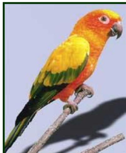
Figura 4: Jandaia Sol, ave símbolo de Teresina.