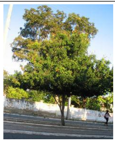
Figura 3: Caneleiro