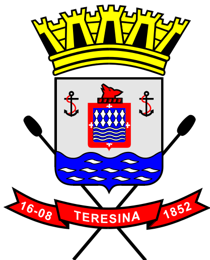
Figura 2: Teresina – Brasão