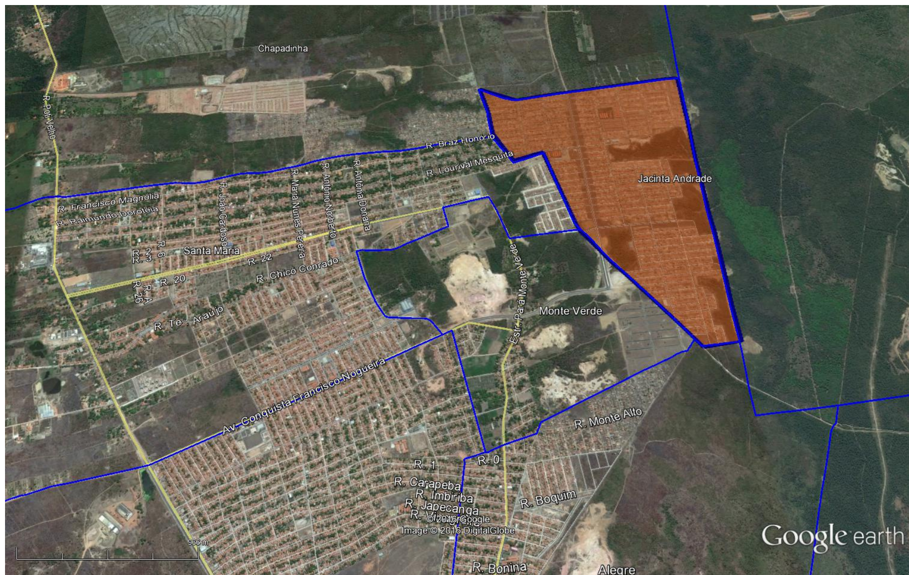
Figura 1: Vista aérea de parte da zona norte e leste da cidade de Teresina, em destaque o bairro Jacinta Andrade. Data: 09/2015